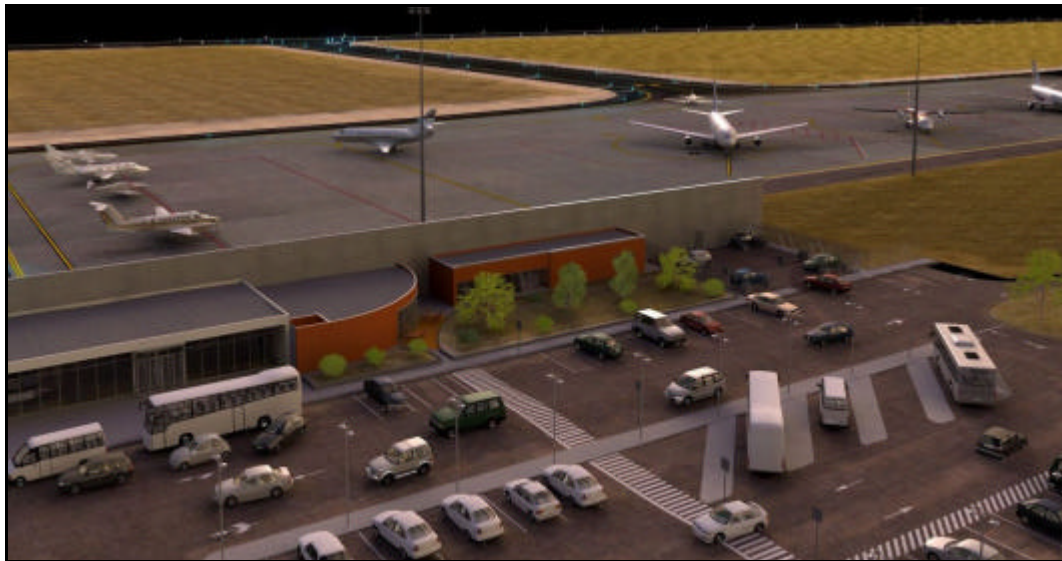
Zona d'aparcament de vehicles i la d'estacionament d'avions

També s'urbanitzarà la zona d'aparcament per als usuaris amb capacitat per a 240 vehicles, els carrers interns que permetran el moviment dins de l'aeroport, el tancat perimetral de vuit quilòmetres de longitud i dos metres d'alçada que protegirà l'aeroport i el camí perimetral interior que farà la volta a tot l'aeroport.