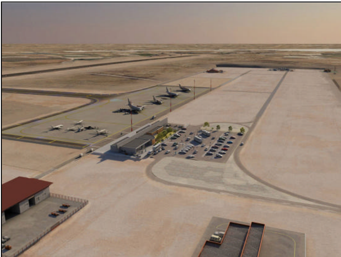
Imatge virtual de futur l'aeroport Alguaire

El Govern ha aprovat avui l'avantprojecte i estudi d'impacte ambiental del Pla director de l'aeròdrom de Lleida-Alguairé i el projecte de l'àrea de moviments i estacionament (Fase I) del primer aeroport que construirà la Generalitat. Es preveu que les obres s'iniciïn aquest estiu i que l'aeroport sigui operatiu l'any vinent.